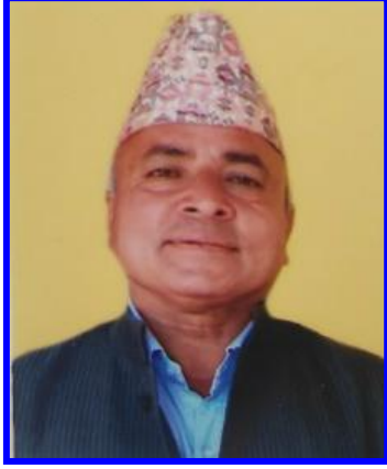
भम्क नेपाल अध्यक्ष सम्पर्क नं. ९८५१२०७९३१ ईमेल: jhamkanepal@gmail.com